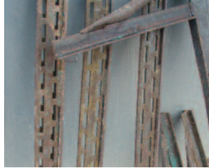
Betonanhaftungen auf Schalungsspannen