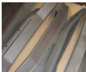
Entgummierung von gebrauchten Faltenbalgteilen