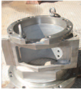
Entlacken eines Mischrohrs, gehärtet und innen hartverchromt