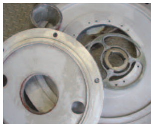
Mühlenteile mit PU-Anhaftungen, mit Rotordüse gereinigt