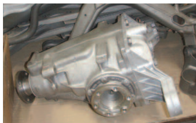
Differenzialgetriebe zusam- mengebaut: entlackt mit Wasserhöchstdruck und mit Glasperlen nachgestrahlt