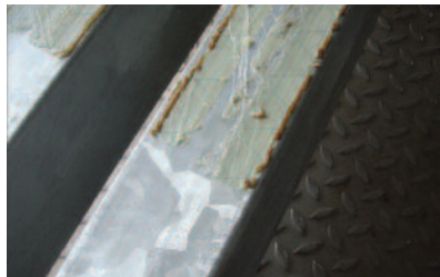
Verzinkte Vordachkonstruk- tion mit Klebeband und Sili- konresten